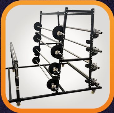
Suporte de Tecido