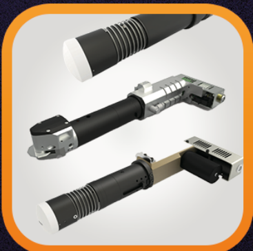
EOT, PDT e PRT